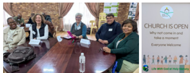
Austausch im Plenum der Konferenz.