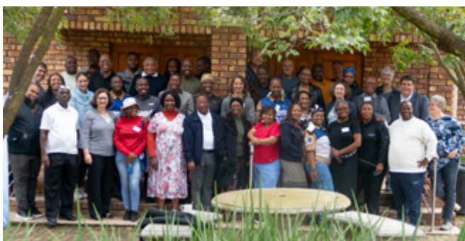
Die Teilnehmer:innen der Konferenz Preaching Hope in a Changing World in Südafrika.

einem Armutsviertel, das von Gewalt und Perspektivlosigkeit geprägt ist. Unterstützen und helfen, wo es am nötigsten ist. Beantragen von Papieren für Kinder, die es im System gar nicht gibt. Lernen, wie technisches Know-how der Warmwasserbereitung, kreatives Arbeiten mit Nähmaschinen und innovativer Gartenbau Überleben sichern kann. Und mitten auf dem Gelände eine alte ehrwürdige ev.-lutherische Kirche, in der mit Kindern gesungen, gespielt und gebetet wird. Dort bedeutet lernen: Überleben trotz widrigster Umstände. Kreativ mit sechs Tagen Stromausfall umzugehen. Die Sorge, dass hunderte von gerade gekeimten Pflanzen das nicht überstehen, sah ich dem Gärtner an. Was wünschst du dir, haben wir ihn gefragt. Verlässliche Stromversorgung würde ihn beruhigen. „Ich liebe meine Arbeit hier! Besonders, wenn die Frauen, Männer und Kinder mit einem Lächeln wieder in ihren Alltag zurückgehen. Das gibt mir Kraft.“ Sie gehen anders als sie gekommen sind: eine Facette der Diakonie in Südafrika. Und dann ging das Lernen für uns weiter: „Hoffnung predigen in einer sich verändernden Welt.“