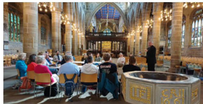
Priestertum der Getauften heute Wakefield Cathedral (bei Leeds).

bildung? Was bedeutet es für dich, in einer lutherischen Kirche zu sein? Wie integrieren wir Menschen diverser Ethnien, wie gestalten wir Gottesdienste multilingual, interkulturell, multiethnisch? Unterschiedliche Antworten und auch unbeantwortete Fragen haben wir aus Johannesburg mitgebracht. Welche Konsequenzen können sich hier in „unserer“ Kirche aus dem Gehörten ergeben? Leben wir weltweite Kirche im besten Sinn niederschwellig. Geben wir der weltweiten Christenheit in unseren Gottesdiensten Raum. Wie könnte diese Haltung in unserer Kirche noch deutlicher werden?