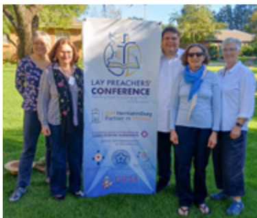
Die Delegation der Ev.-luth. Landeskirche Hannovers in Johannesburg.

einem Armutsviertel, das von Gewalt und Perspektivlosigkeit geprägt ist. Unterstützen und helfen, wo es am nötigsten ist. Beantragen von Papieren für Kinder, die es im System gar nicht gibt. Lernen, wie technisches Know-how der Warmwasserbereitung, kreatives Arbeiten mit Nähmaschinen und innovativer Gartenbau Überleben sichern kann. Und mitten auf dem Gelände eine alte ehrwürdige ev.-lutherische Kirche, in der mit Kindern gesungen, gespielt und gebetet wird. Dort bedeutet lernen: Überleben trotz widrigster Umstände. Kreativ mit sechs Tagen Stromausfall umzugehen. Die Sorge, dass hunderte von gerade gekeimten Pflanzen das nicht überstehen, sah ich dem Gärtner an. Was wünschst du dir, haben wir ihn gefragt. Verlässliche Stromversorgung würde ihn beruhigen. „Ich liebe meine Arbeit hier! Besonders, wenn die Frauen, Männer und Kinder mit einem Lächeln wieder in ihren Alltag zurückgehen. Das gibt mir Kraft.“ Sie gehen anders als sie gekommen sind: eine Facette der Diakonie in Südafrika. Und dann ging das Lernen für uns weiter: „Hoffnung predigen in einer sich verändernden Welt.“