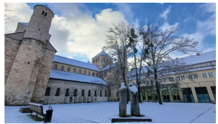
Innenhof des Michaelisklosters Anfang Dezember

Ich lese den Predigttext für den Neujahrstag (Jak 4,13-17) als hilfreichen Rat für den Blick auf den Kalender vor uns: Heute oder morgen werden wir in die und die Stadt gehen, wir werden dort ein Jahr zubringen und Handel treiben und Gewinn machen (V.13). Die Menschen, die zitiert werden, reden im Futur. So, als ob sie die Zukunft selbst bestimmen können! Nicht das Planen ist das Problem, sondern die Einstellung dabei, betont der Verfasser des Jakobusbriefs. Deshalb gibt es eine sprichwörtlich gewordene Anleitung: „Dagegen sollt Ihr sagen: Wenn der Herr will, werden wir leben und dies oder das