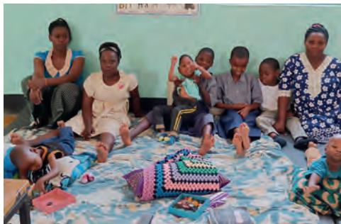
Mitarbeiterinnen und Kinder des Zentrums