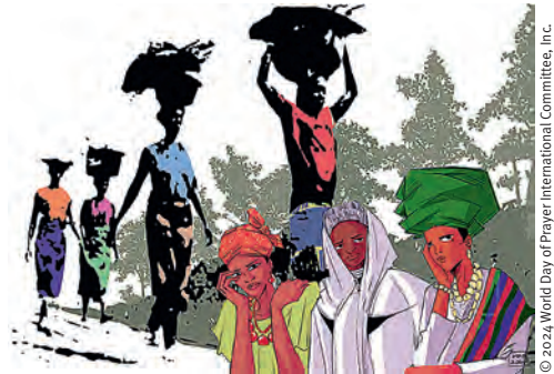
„Rest for the Weary“ von der Künstlerin Gift Amarachi Ottah

© 2024 World Day of Prayer International Committee, Inc.