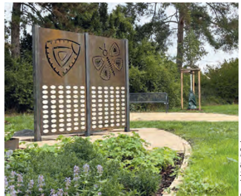
Schmetterlingsfeld mit Stele