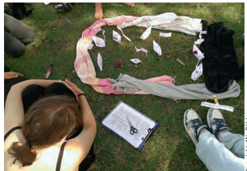
Halt im Sturm