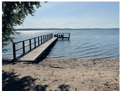
Badestelle Plöner See