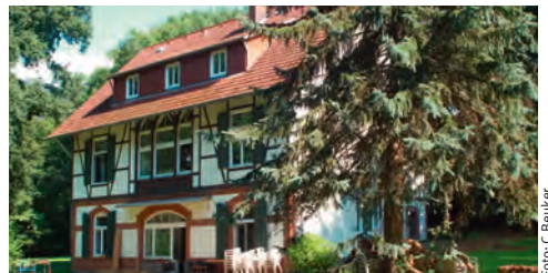
Unser Ferienhaus „Süntelbuche“