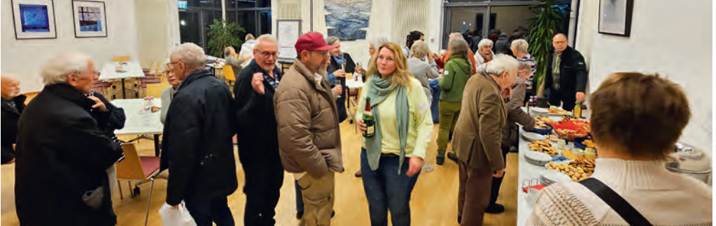
Angeregter Austausch bei der Gemeindeversammlung

„Wo zwei oder drei versammelt sind in meinem Namen, da bin ich mitten unter ihnen“ – heißt es im Matthäusevangelium.