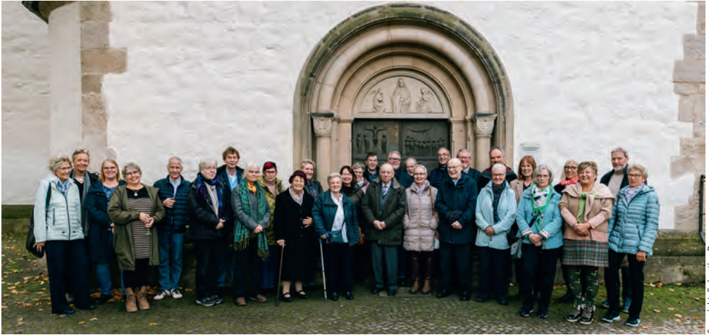
Jubelkonfirmand*innen vor der Klosterkirche Marienwerder