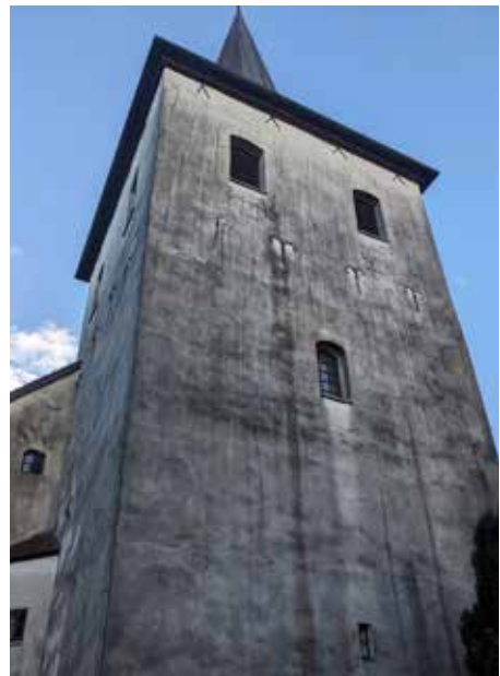
An nassen Tagen besonders sichtbar: Der Putz des Kirchturms muss bald saniert werden

Überweisungen sind möglich auf das Spendenkonto des Kirchenkreises bei der Sparkasse Rotenburg Osterholz, IBAN: DE40 2415 1235 0025 1585 85, Verwendungszweck: Freiwilliger Gemeindebeitrag Scheeßel, Ihr Name und Ihre vollständige Anschrift. Eine Spendenbescheinigung wird unaufgefordert zugesandt.