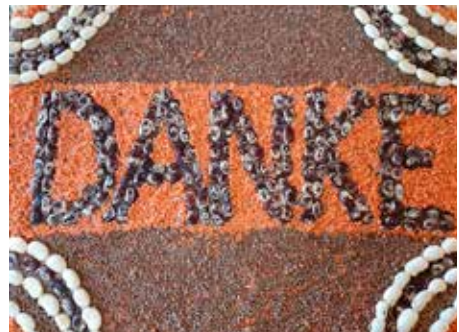
Wunderbarer Erntedankschmuck vom Team aus Wittkopsbostel