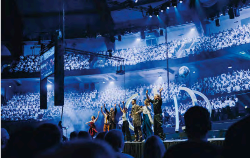
Die Premiere in Dortmund.

Am 6. Februar 2027 wird in der ZAG Arena in Hannover das Chormusical „Judith und das Wunder der Schöpfung“ aufgeführt. Für diese Produktion werden Chöre und einzelne Sänger:innen aus ganz Niedersachsen gesucht, Chorerfahrung ist dabei keine