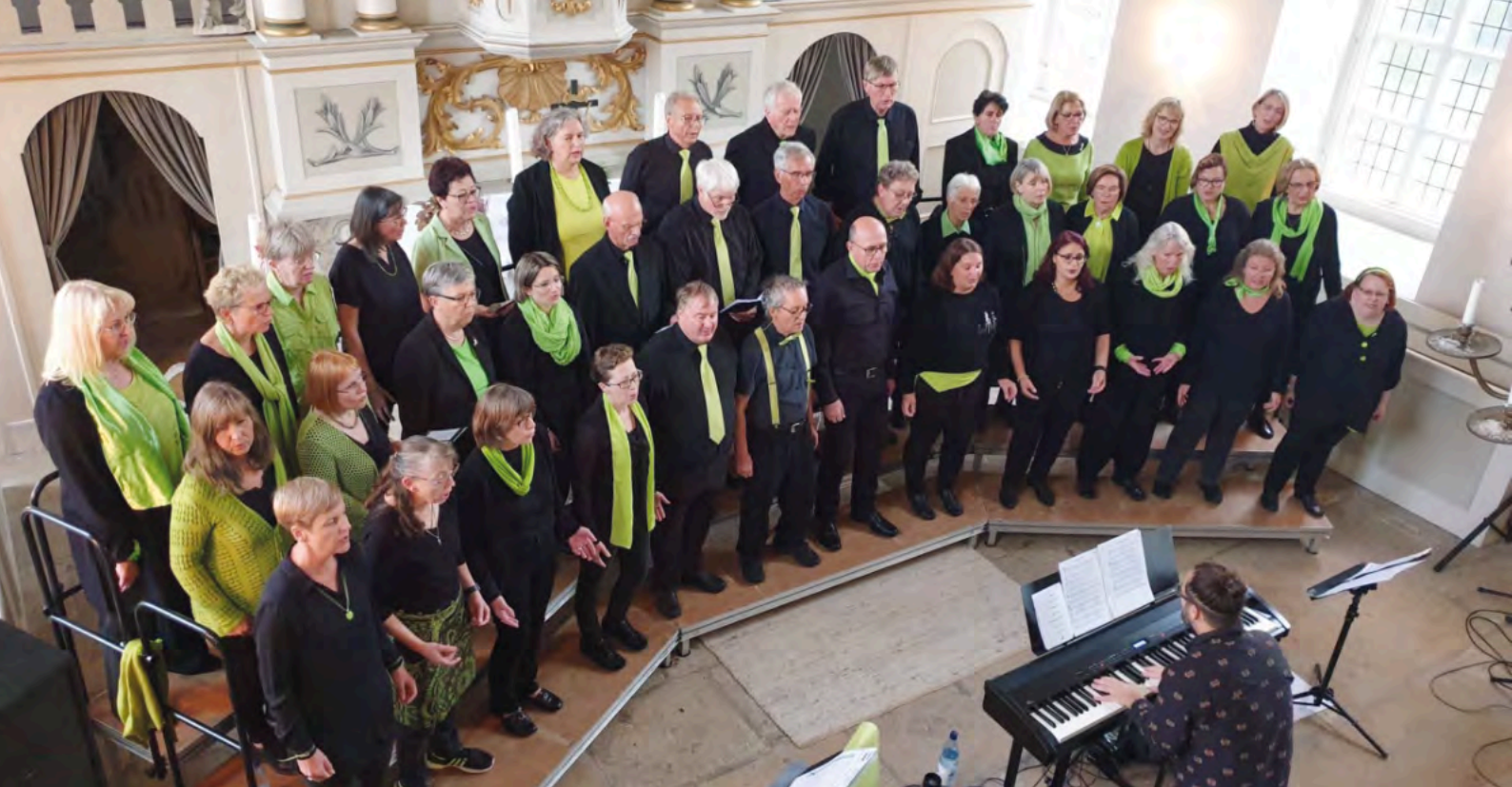
Der Chor Swinging Church aus Garbsen ist einer der Gastchöre im Gottesdienst der Gospelkirche.