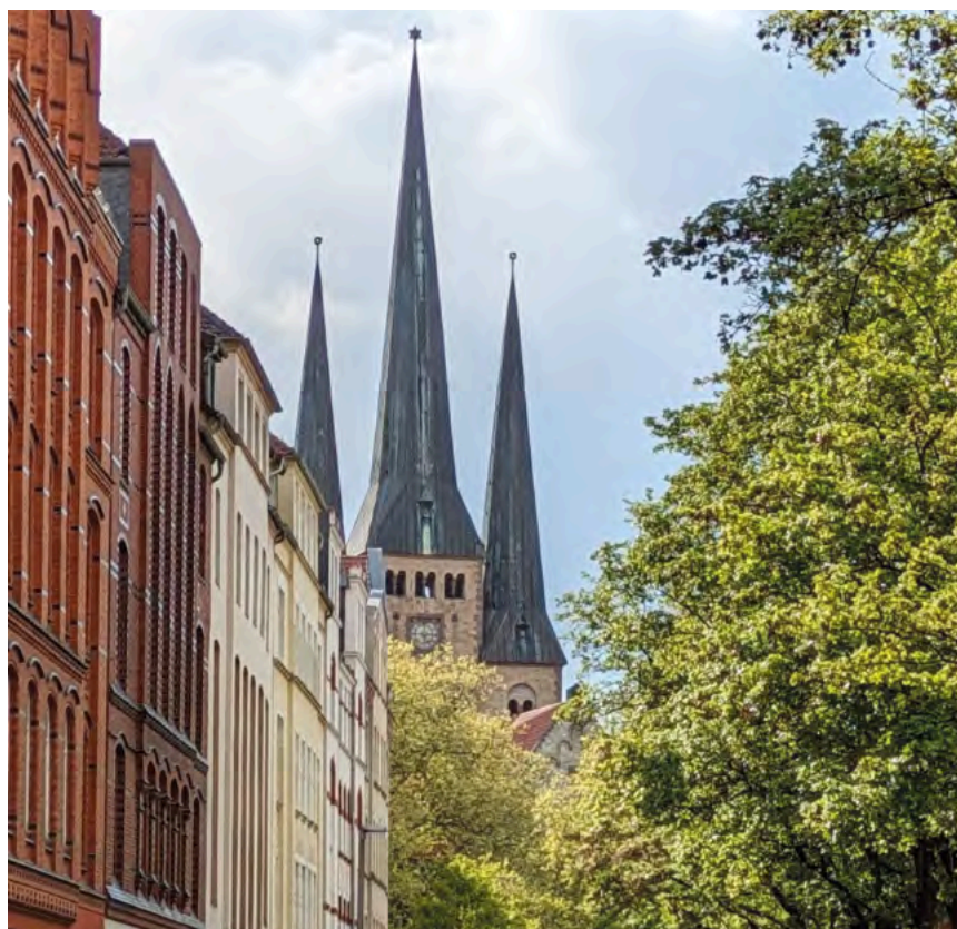
Die Bethlehemkirche wird erst beim Abbiegen in die Bethlehemstraße sichtbar.

kreten Unterstützung Bedürftiger zeigt sich das, was Bonhoeffer meinte: Gerechtigkeit tun und dabei den Zusammenhalt stützen. Die unsichtbare Kirche braucht die sichtbare Struktur, um wirksam zu werden. Aber die sichtbare Kirche braucht ebenso die Menschen in der „unsichtbaren“ Gemeinschaft – auch die Zweifelnden und Su-