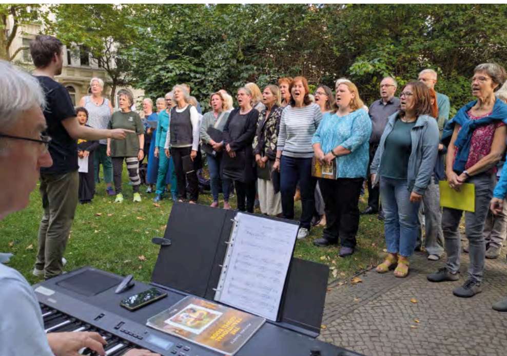
Zur Ausstellungseröffnung im Sommer letzten Jahres versammelten sich Mitglieder verschiedener Chöre aus Linden-Limmer zum gemeinsamen Auftritt.

ein Brumbär (oder eine Brumbärin) dazwischen ist. Es gibt Chöre für bestimmte Altersgruppen wie Kinderchöre und Seniorenchöre. Singen auf der Palliativstation im Krankenhaus Siloah. Im großen Chorprojekt der kreativen Kirche kann man mit 6000 Singenden zusammen sein. Das „Rund-um-die-Uhr-Singen“ auf dem Kirchentag Hannover im Mai