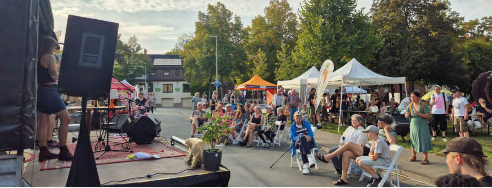
Live-Musik beim Kiezfest 2025.