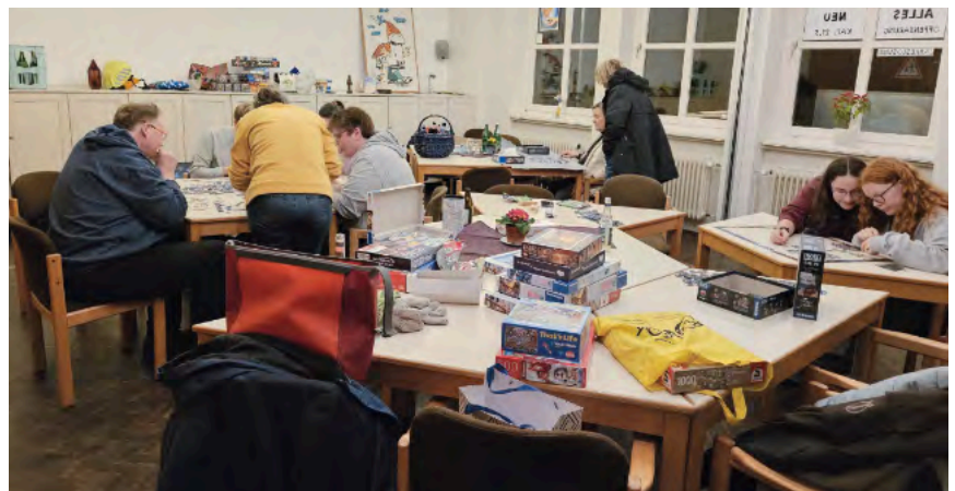
Große Auswahl beim Spiele- und Puzzleabend im Gemeindehaus Limmer