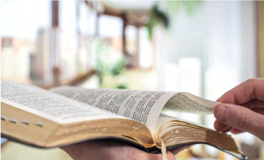
Foto: Bibellesen will gelernt sein