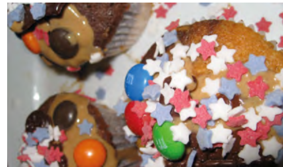
Küchlein im LiLi-Land.

Abgabe der Backwerke: Am Veranstaltungstag bis 14.30 Uhr im Gemeindesaal (Bethlehemplatz 1) Bewertung der Jury 14.30-15.00 Uhr (nicht öffentlich) Siegerehrung um 15.30 Uhr auf