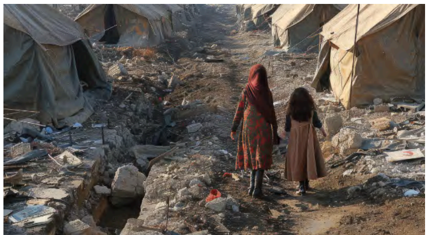
Foto: Mädchen im Flüchtlingslager