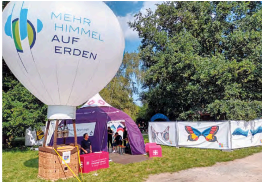
Kirchzelt mit Heißluftballon.

Mit einer Fotowand-Aktion unter dem Thema „Kirche in Linden und Limmer verleiht Flügel“ bereichert die Evangelische Kirche die Faustwiese um eine weitere Attraktion. Am Heißluftballon gibt es gemütliche Sitzsäcke, wo Festbesucher:innen sich ausruhen können. Davor laden Plakatwände dazu ein, sich mit unterschiedlichen