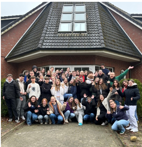
Juleica-Schulung mit dem Kirchenkreis in Oese.

Was für eine Woche! 75 motivierte Jugendliche aus den fünf Regionen des Kirchenkreises haben im Januar eine spannende Zeit in Oese erlebt - voller Lernen, Spaß und witziger Highlights. Von Anfang an war klar: diese Gruppe hat Energie und will was bewegen. Das zeigte sich schnell beim mitreißenden Piratentanz und einem Improtheater-Abend voller kreativer Überraschungen. Doch neben all dem Spaß gab es