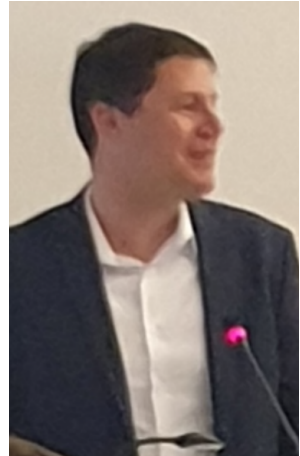
Vahlde's Bürgermeister Tobias Koch