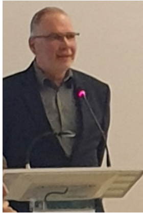
Fintels Bürgermeister Claus Aselmann