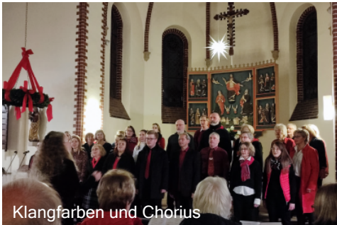
Klangfarben und Chorius

In der Adventszeit fanden in unserer Kirche 2 wunderbare Konzerte statt. Am 3. Dezember 2022 traten die Chöre Klangfarben und Chorius auf, am 18. Dezember 2022 der Chor der Hamburger Singakademie. Beide Konzerte waren nicht nur gut besucht, sie haben auch begeistert.