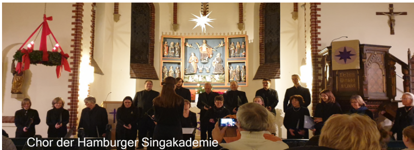
Chor der Hamburger Singakademie

In der Adventszeit fanden in unserer Kirche 2 wunderbare Konzerte statt. Am 3. Dezember 2022 traten die Chöre Klangfarben und Chorius auf, am 18. Dezember 2022 der Chor der Hamburger Singakademie. Beide Konzerte waren nicht nur gut besucht, sie haben auch begeistert.