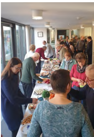
Es gab ein leckeres Büfett