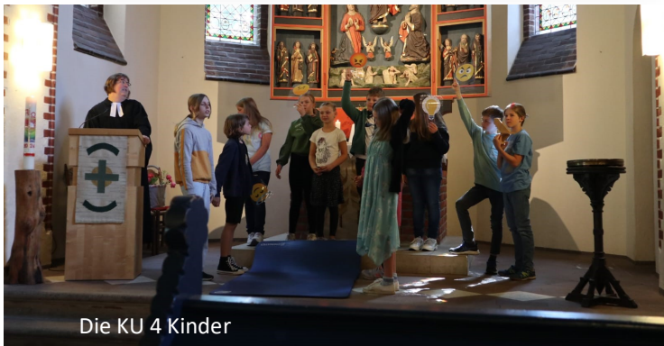
Die KU 4 Kinder