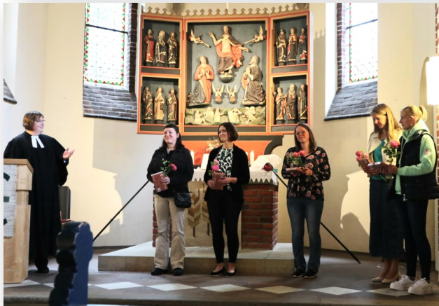
Dank an die am KU 4 beteiligten Mütter

sammen mit Familien, Paten und Gemeinde. Bei der Geschichte von der Heilung eines Gelähmten machten die KU 4-Kinder fröhlich mit, bevor sie nach dem Abendmahl einen Karabinerfisch sowie eine Urkunde erhielten. Ein besonderer Dank galt den Eltern, die sich im KU 4 engagiert eingebracht hatten. Beim gemeinsamen Auszug an einem Seil konnten wir handfest entdecken, „was uns (zusammen) hält“.