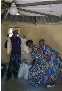
Freude über mitgebrachte Nahrungsmittel bei dem letzten Besuch einer Gruppe aus unserer Kirchengemeinde in Eloolo im Jahr 2017

Sofort nach Erreichen des Hilferufs aus Eloolo hat unser Kirchenvorstand beschlossen, 5000 Euro nach Eloolo zu schicken. Herzlich danken möch-