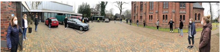
Das komplette KonFESTival-Team

Die Fragen beantwortete das Leitungsteam des KonFESTivals 2021