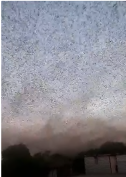
Heuschreckenplage über Eloolo