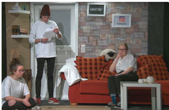
... die fantastische Theatergruppe

eigenen Glauben auseinandersetzen. Besonders ist beim KonFESTival, dass mehrere Gemeinden zusammenkommen und es in den Ta-