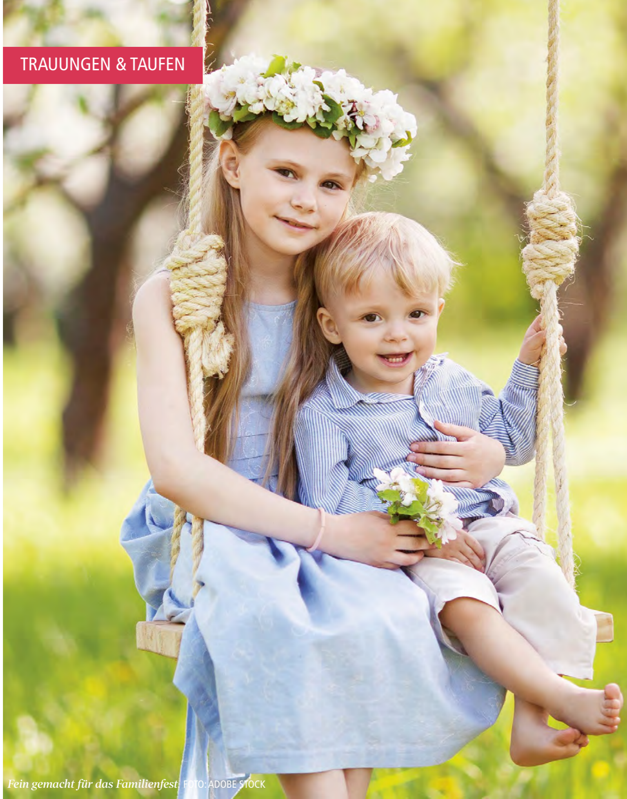
Fein gemacht für das Familienfest