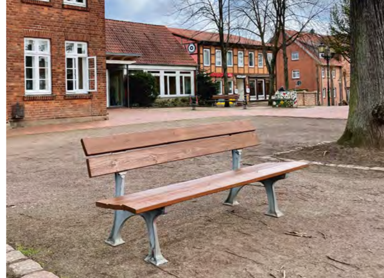
Links: Die neuen Bänke auf dem Kirchplatz. Rechts: Buch-Tipp Basisbibel

Stichwort: „Ondini-Jugendförderung“ oder „Ondini-Coronahilfe“