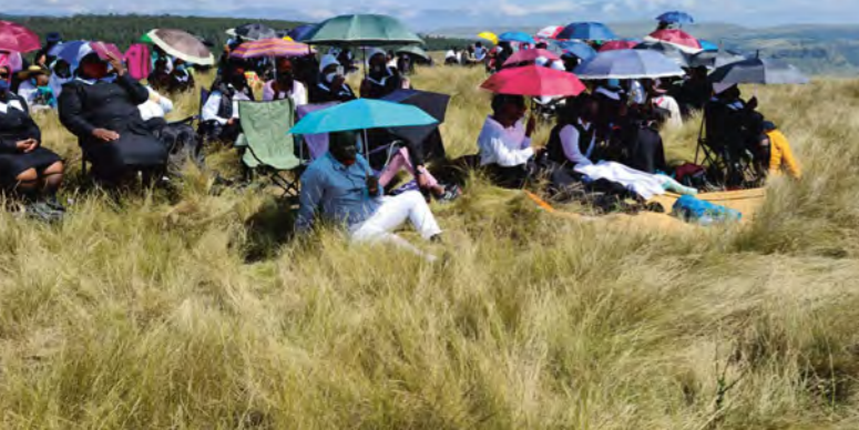
Ondini – Karfreitag zur Kreuzandacht