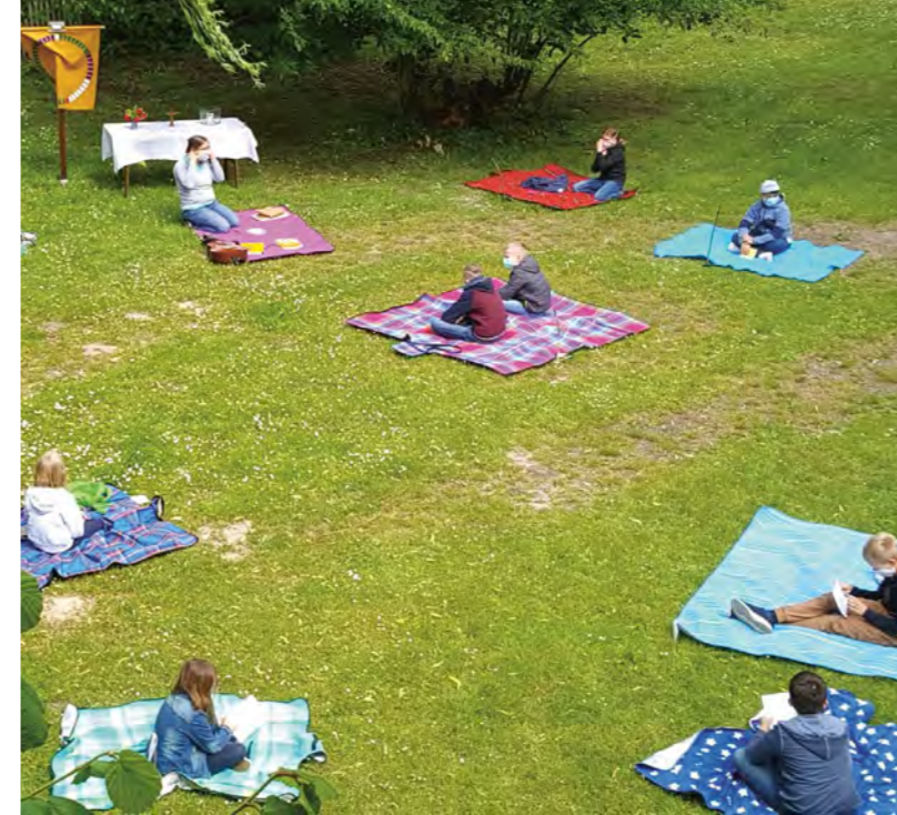
Links: Kindergottesdienst auf Picknickdecken. Rechts: Michaela Mauß, stv. Kita-Leitung

Kinder in der Kirche... haben Spaß und dürfen unter Einhaltung der Abstands- und Hygieneregeln Kindergottesdienste feiern. Wie geht das? Jedes Kind bringt für den eigenen Platz eine Picknickdecke mit und nutzt einen Mund-Nase-Schutz. Bitte das Kind für den Sonntag, an dem es kommen möchte, anmelden und eine Kontaktadresse hinterlegen. Die Plätze sind leider begrenzt und nur angemeldete Kinder dürfen teilnehmen. Bei pandemiebedingten Änderungen werden angemeldete Teilnehmer benachrichtigt. jb TERMINE: 30. Mai, 6. Juni, 13. Juni, 20. Juni und 27. Juni jeweils von 11-12 Uhr auf der Wiese hinter der Alten Superintendentur, Pastorenstr. 20, Kontakt: Julica Boyken, Tel. 05821/992 23 18