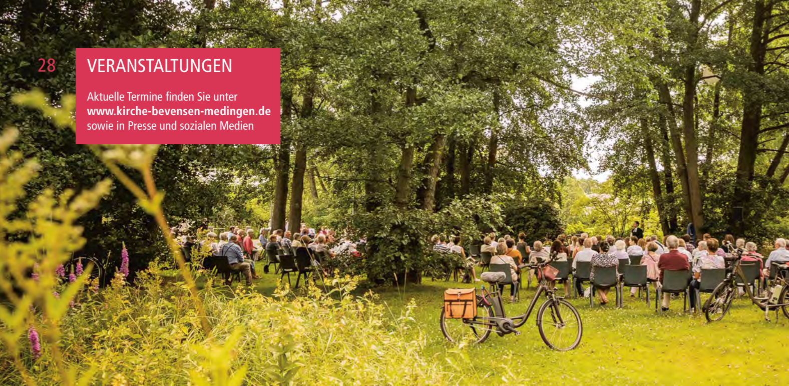
Gottesdienst im Kurpark

Aktuelle Termine finden Sie unter www.kirche-bevensen-medingen.de sowie in Presse und sozialen Medien