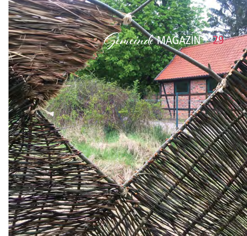
Kunst im Freien: „Shelter/Im Garten“

Ihre Konfirmation ist 50 bzw. 60 Jahre her? Dann laden wir Sie herzlich ein, mit uns Ihre Goldene oder Diamantene Konfirmation zu feiern! Am 20. Juni laden wir die Konfirmand*innen der Jahrgänge 1960/61 zum Festgottesdienst anlässlich der Diamantenen Konfirmation um 9.30 Uhr in die Klosterkirche Medingen bzw. 11 Uhr in die Dreikönigskirche Bad Bevensen ein. Am 27. Juni sind die Konfirmand*innen der Jahrgänge 1970/71 zu einem gemeinsamen Festgottesdienst anlässlich der Goldenen Konfirmation in die Dreikönigskirche eingeladen. Auch wenn Sie Ihre Konfirmation vor 50 oder 60 Jahren in einer anderen Gemeinde gefeiert haben, sind Sie herzlich eingeladen, mit uns in diesem Festgottesdiensten Ihr Jubiläum zu feiern! Und falls Sie ein höheres Konfirmationsjubiläum (65 oder 70 Jahre) feiern möchten, dann ist auch das im Rahmen unserer beiden Festgottesdienste zur Diamantenen Konfirmation möglich. Wenn Sie an einem der Festgottesdienste teilnehmen möchten, melden Sie sich bitte zuvor im Kirchenbüro bei Anja Wende, Tel. 05821/1364. jl TERMINE: 20.06.2021, Festgottesdienste Diamantene Konfirmation, 9.30 Uhr Klosterkirche Medingen, 11 Uhr Dreikönigskirche Bad Bevensen 27.06.2021, Festgottesdienst Goldene Konfirmation, Dreikönigskirche Bad Bevensen