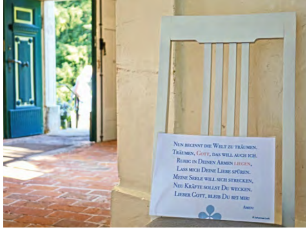
Kleine Anregung zur Meditation

Wieder zurück in der Vorhalle geht es noch einmal an vier Stühlen vorbei, an denen Texte befestigt sind, die unter anderem drei gute Dinge der vergangenen Woche in den Blick nehmen lassen. Wie zur Abendruhe ausgestreckt - so entspannt fühlt sich nun die Seele an, wenn die Besucher*innen nach dem Rundgang das Portal der Kirche wieder erreichen. Hier erwartet sie zum Abschluss noch ein persönlicher Segen des Pastors für den Abend, das Wochenende und den kommenden Monat. Krafterfüllt geht es dann hinaus, wo einige Besucher nun noch auf einem Abendspaziergang die Eindrücke nachwirken lassen. „Wenn ich hier gewesen bin, gehe ich ganz anders ins Wochenende. Viel entspannter und ruhiger“ , sagt die junge Frau mit den braunen Haaren. „Einmal im Monat hier zu sein tut mir und meiner Seele gut, das möchte ich nicht mehr missen!“