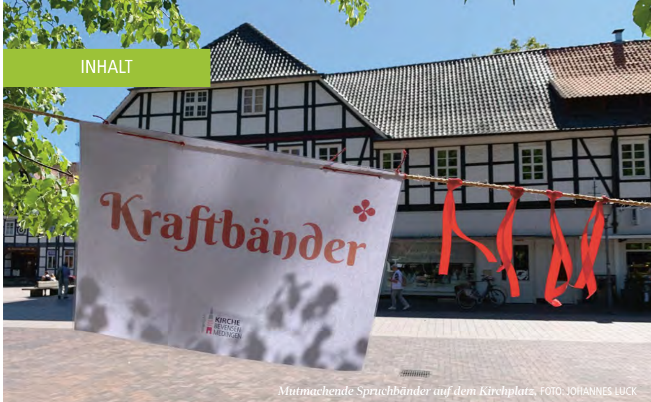
Mutmachende Spruchbänder auf dem Kirchplatz.