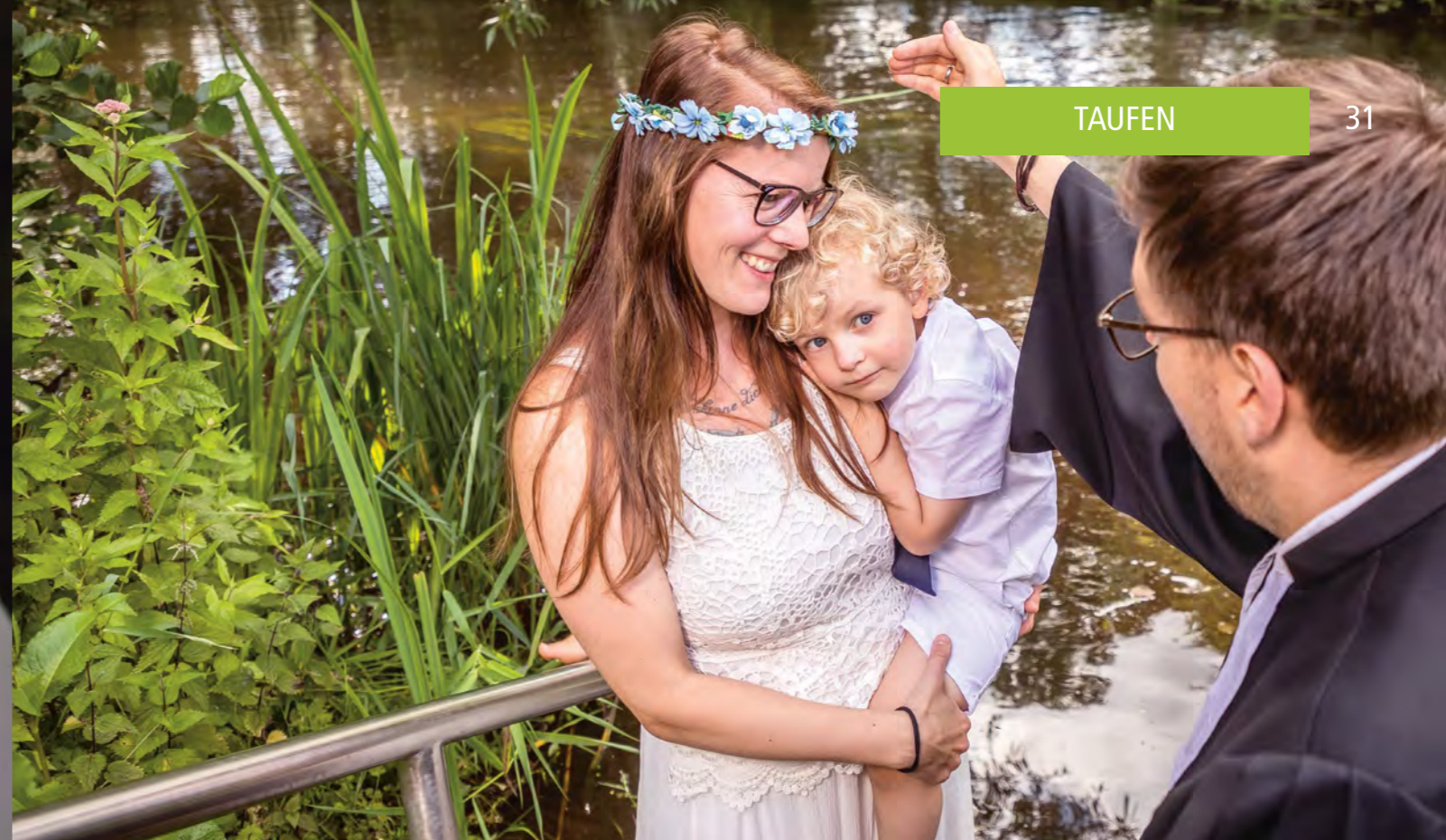
Taufe in der Ilmenau im Sommer 2020, FOTO: JOCHEN QUAST