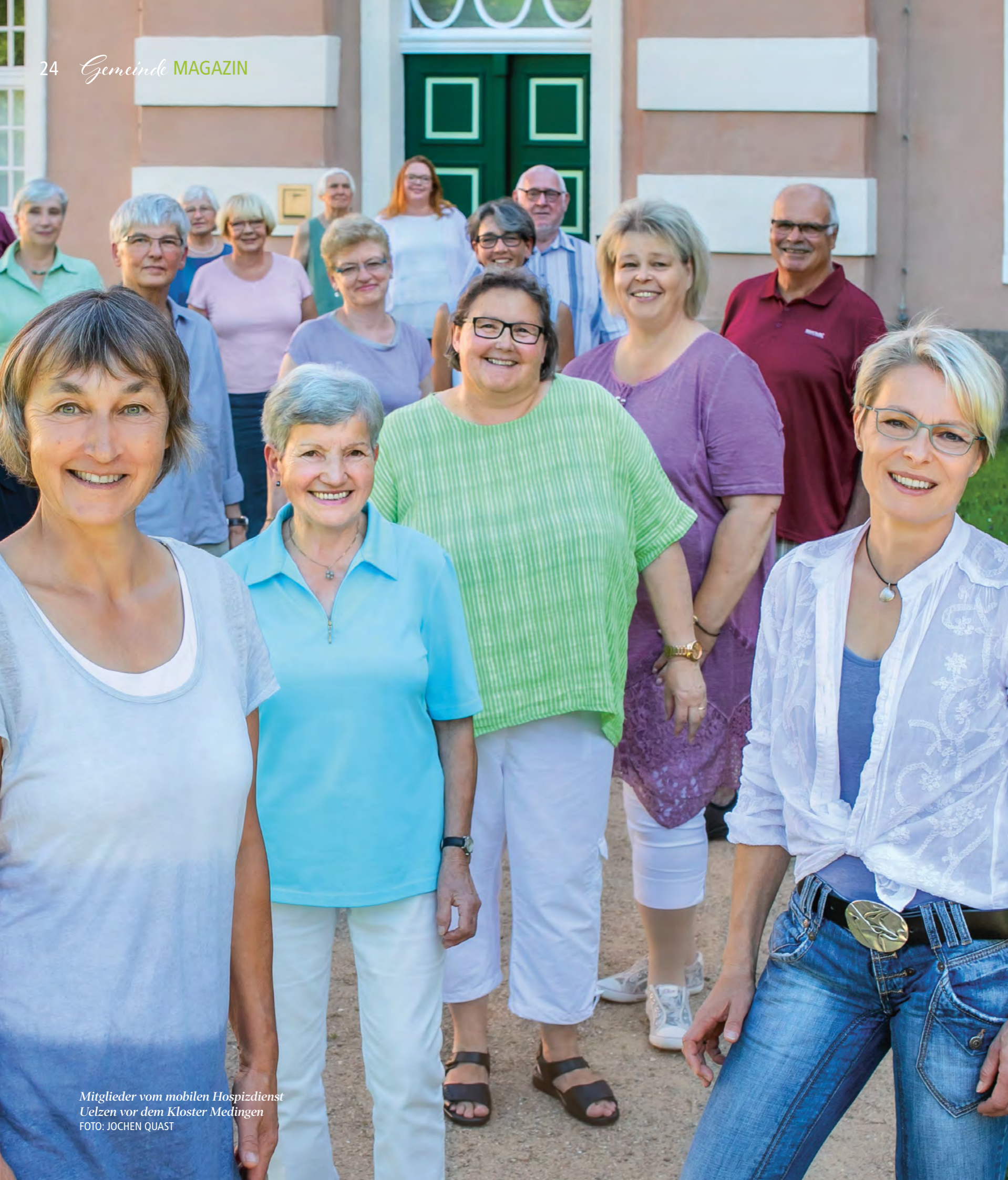
Mitglieder vom mobilen Hospizdienst Uelzen vor dem Kloster Medingen