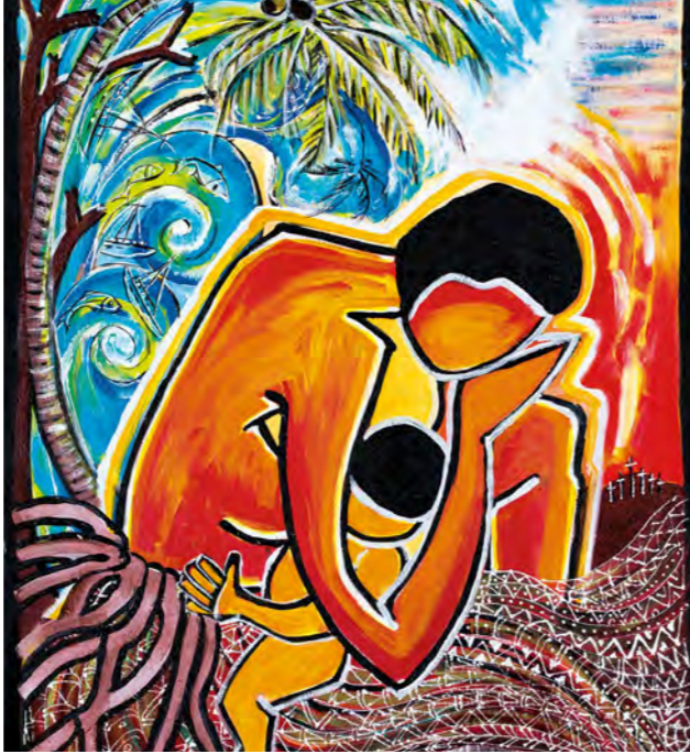
Gemälde zum Weltgebetstag 2021 Vanuatu: „Cyclon PAM II. 13th of March 2015“. © JULIETTE PITA

Klima-Pilger-Weg ev. Frauen Württemberg https://www.frauen-efw.de/fileadmin/user_upload/Klimaweg_Vanuatu.pdf Beate Baumann