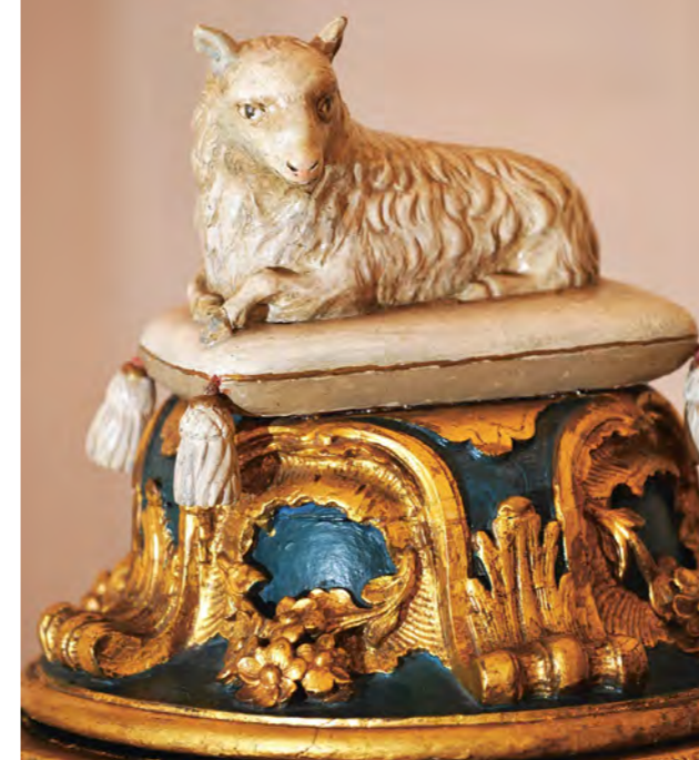
Osterlamm, Deckel des Taufbeckens in der Neustädter Hof- und Stadtkirche in Hannover, FOTO: © EMSZ/JENS SCHULZE

TERMIN: Christi Himmelfahrt, 13.05.2021, 11 Uhr