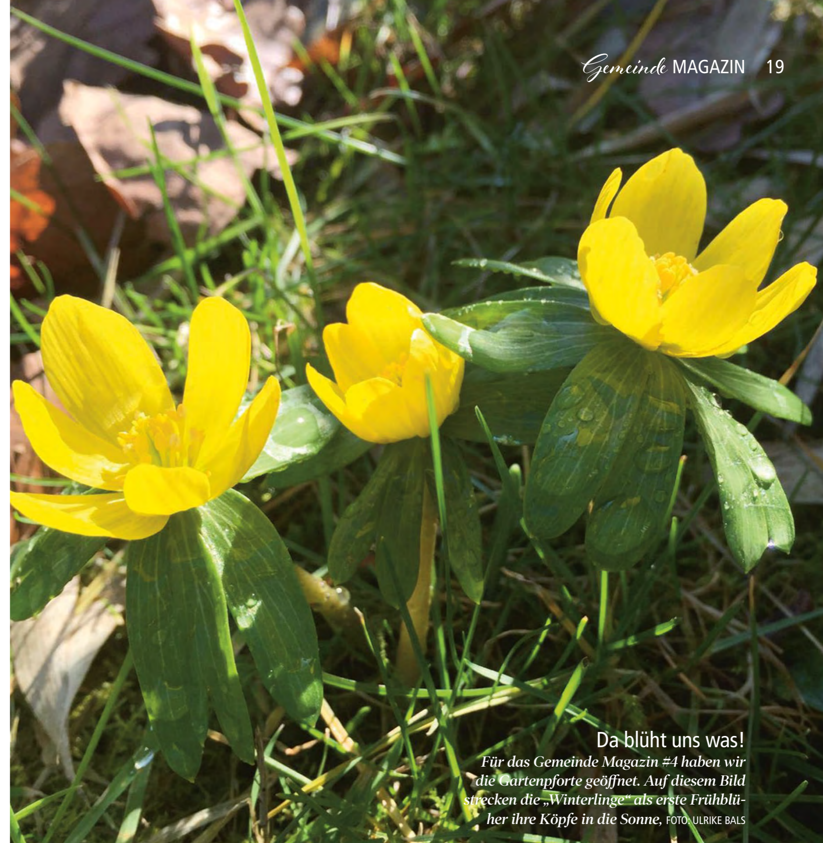
Da blüht uns was! Für das Gemeinde Magazin #4 haben wir die Gartenpforte geöffnet. Auf diesem Bild strecken die „Winterlinge“ als erste Frühblüher ihre Köpfe in die Sonne