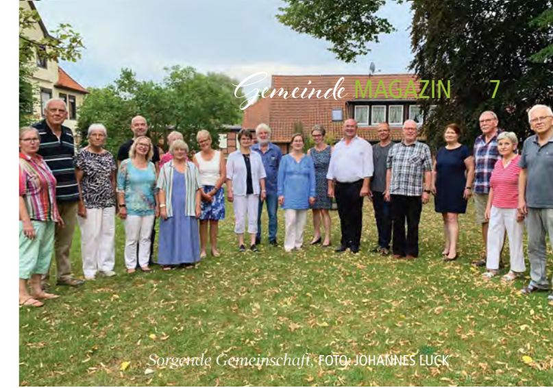
Sorgende Gemeinschaft

erstellte für die Tätigen in den „zugehenden Hilfen“ und die Kirchengemeinden einen Handlungsleitfaden mit Hygienevorschriften, um Menschen mit Hilfebedarf vor einer Ansteckung zu schützen. Und in Zusammenarbeit mit den Seelsorgenden in den Sorgenden Gemeinschaften gestaltete sie eine Hotline für Menschen, die sich Sorgen machen, die infiziert sind oder Probleme im Umgang mit Corona haben. Seither haben sich viele Menschen gemeldet, bekommen Beratung und/oder Hilfe, denn die Alltagsunterstützung ist ja weiterhin erlaubt - vorausgesetzt, dass die Helfer*innen es sich zumuten. So kommt es nicht nur zu Anrufen, sondern auch Besuchen in Gärten, auf Terrassen, zu gemeinsamem Einkaufen und Begleitungen zu Ärzten. Außerdem initiiert das Netzwerk die Presseaktion: „Bilder von Menschen in Corona-Zeiten“. Einsame, Betroffene, Pflegenden, Pastoren, Politik, Hospizdienst, JUZ... alle können mitteilen, was sie in der Corona-Zeit beruflich und privat bewegt. Zusammenfassend lässt sich sagen, die Sorgende Gemeinschaft ist sehr vielfältig aufgestellt und gemeinsam unterwegs. Und so gelingt es ihr auch die schwierigen Herausforderungen der Corona-Zeit zu meistern. Silke Jäschke