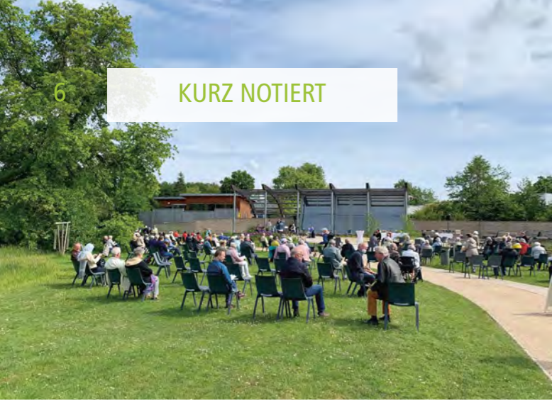
Für viele Menschen mehr als nur eine Notlösung: die schönen Freiluft-Gottesdienste im Kurpark 2020, FOTOS: JOHANNES LUCK