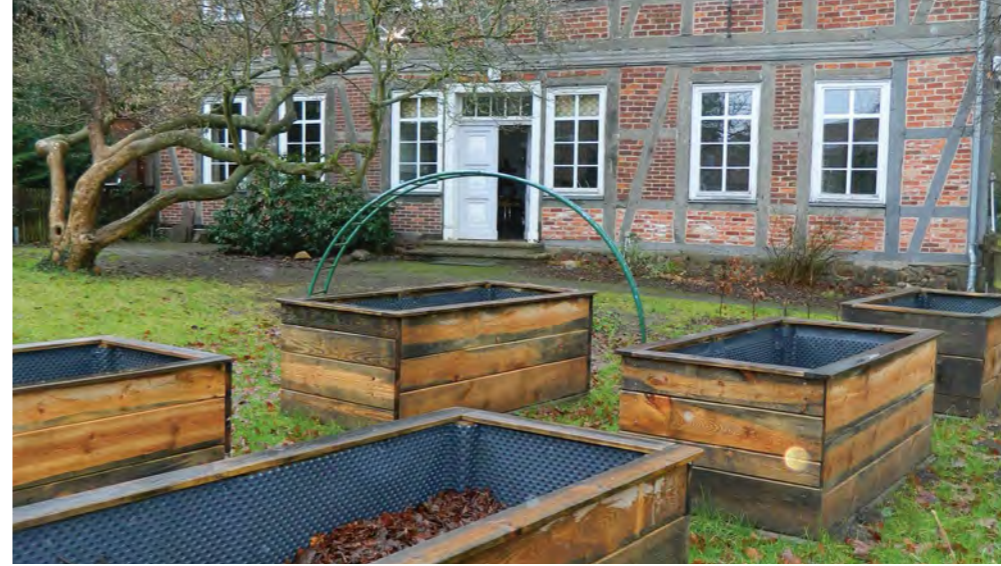
Oben: Die Hochbeete sind vorbereitet und warten darauf, mit neuem Leben gefüllt zu werden. Rechts: Die Gesichter Christi erzählen von Jesu Leben