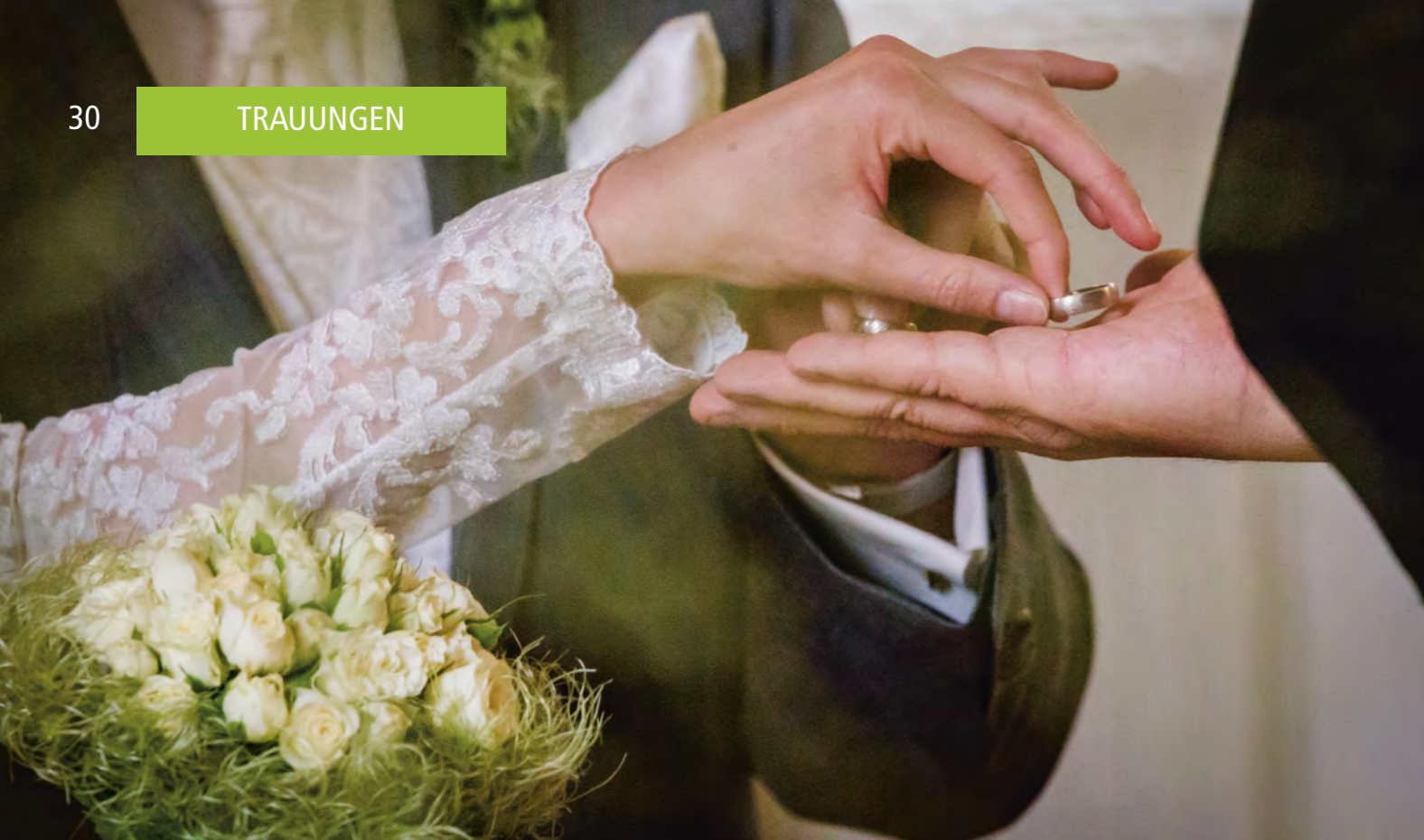
Brautpaar bei der kirchlichen Trauung