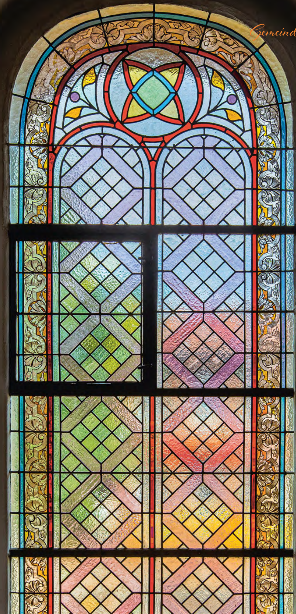
Die großen Fenster der Dreikönigskirche wurden beim Wiederaufbau von 1812 mit farbigem Bleiglas gestaltet