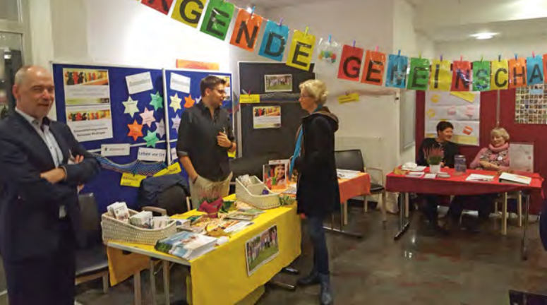
Die Sorgende Gemeinschaft vertreten auf dem HGZ-Forum im November 2019.

A uch war schnell klar, dass diese Stadt einen Bürgerbus braucht. Der zunächst unabhängig von der Sorgenden Gemeinschaft gegründete „Verein BürgerBus Bad Bevensen“ wurde wenig später ein wichtiges Mitglied des Netzwerkes. Er hat es sich zur Aufgabe gemacht, Älteren oder Menschen mit Behinderungen durch das Angebot zusätzlicher Buslinien, die Möglichkeit zum Einkaufen und den Zugang zu den Gesundheitseinrichtungen zu geben. Dazu benötigen sie zusätzliche, ehrenamtliche Bürgerbusfahrer.