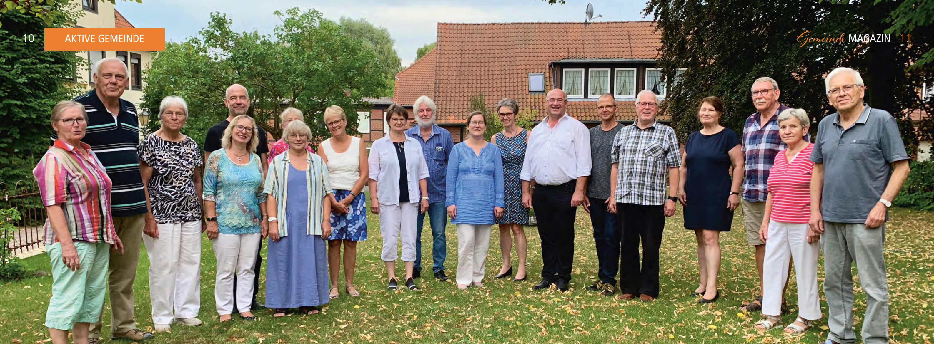
Das Netzwerk der Sorgenden Gemeinschaft.