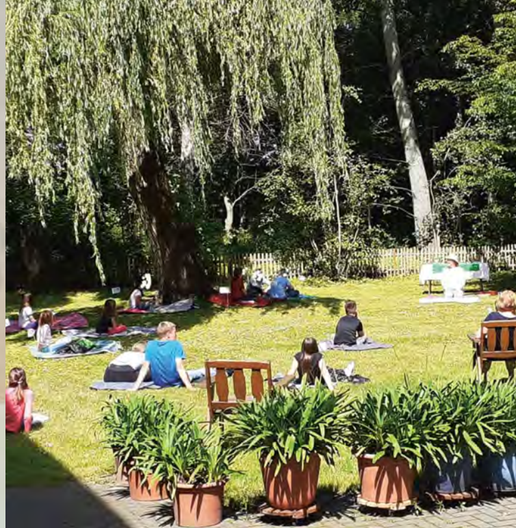
Links: Kreativer Umgang mit Corona-Auflagen: die Picknick-Gottesdienste Rechts: Das Adventsmärktchen der Ev. KiTa Bad Bevensen