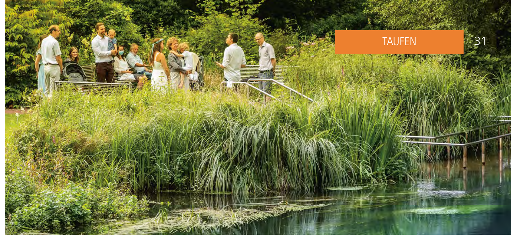
Taufe in der Ilmenau im Kurpark von Bad Bevensen.

TERMIN: Gottesdienst und Feier zum Reformationstag, 31.10.2020 um 11 Uhr in und um die Dreikönigskirche Bad Bevensen