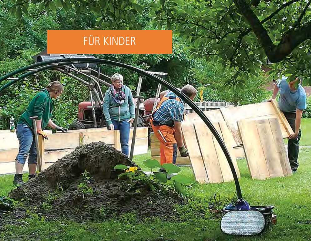
Links: Aufbauaktion der Hochbeete an der Alten Superintendentur. Rechts: Die bunte Spendenkirche.