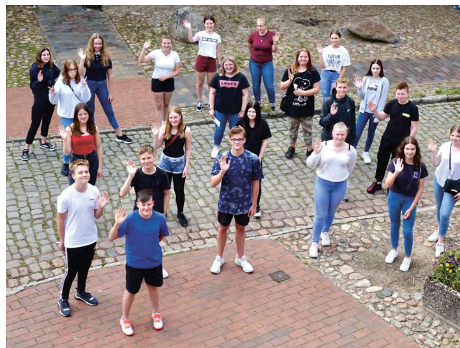
Konfirmandinnen und Konfirmanden der Gesamtkirchengemeinde Bevensen-Medingen im Jahr 2020. Die Konfirmanden auf dem oberen Bild werden vor der Klosterkirche Medingen, diejenigen auf dem unteren Bild im Kurpark konfirmiert. Eine detaillierte Namensliste liegt im Gemeindehaus am Kirchplatz aus.