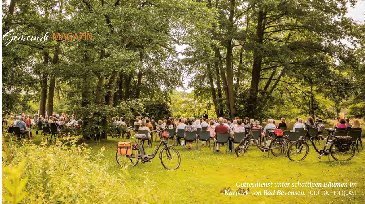
Gottesdienst unter schattigen Bäumen im Kurpark von Bad Bevensen.