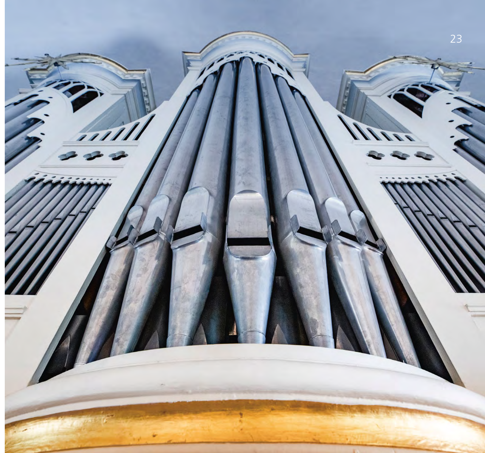
Die Orgel der Dreikönigskirche wurde 1864 von Furtwängler & Hammer bei Hannover gebaut, FOTO: JOCHEN QUAST

Erinnerungen sind kleine Sterne, die tröstend * in das Dunkel unserer Trauer leuchten. *