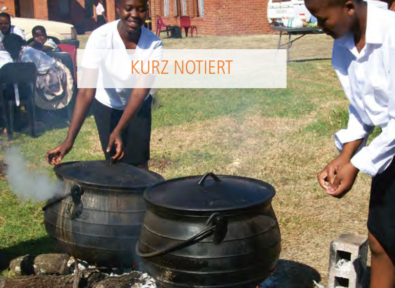
Kochen in Ezakheni.